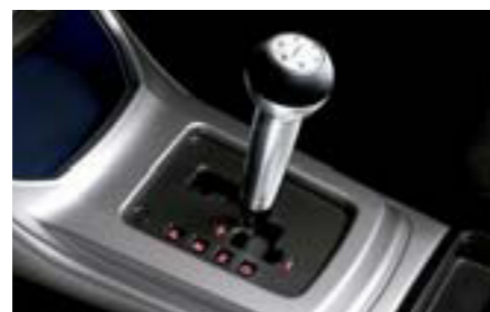
82 Hliníková voliaci páka (AT) C101ESA002 W Športová hliníková voliaci páka s logom Subaru.