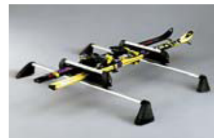
51 Nosič na lyže (4 páry) E361EAG500 W Až pre 4 páry lyží alebo 2 snowboardy. *Vyžaduje sa základný nosič.