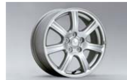
28 7-lúčové 16" disky z ľahkých zliatin 28111AG001 W 16x6.5JJ offset 55