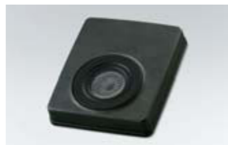
99 Subwoofer H6305FG000 W Výstupný výkon 120 W na zvýraznenie basových tónov.