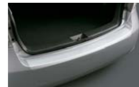
43 Ochrana nakladacej hrany priesvitná (5-dv.)

Odolná plastová ochrana nakladacej hrany pri nakladaní a vykladaní.