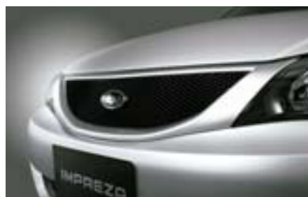
5 Sieťová mriežka chladiča J1010FG101NN W Zásadne zmení vzhľad prednej časti. *Dodáva sa nenalakované.