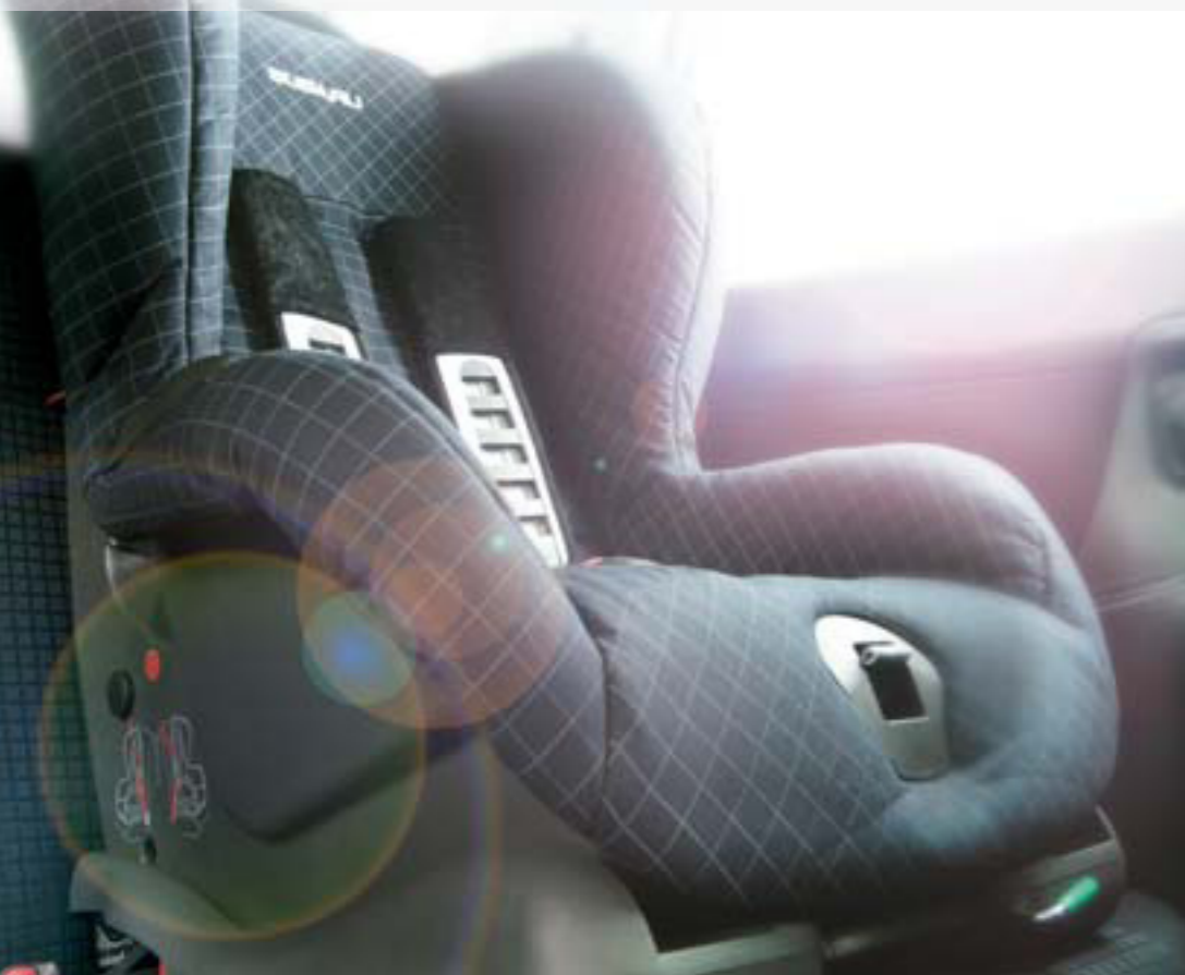
Vozidlo s detskou sedačkou SUBARU Duo plus.