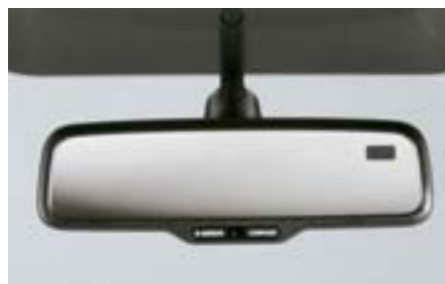
84 Vnútročné zrkadlo s kompasom H501SFG000 W Po dopade svetla zozadu automaticky stmavne. Obsahuje elektronický kompas. *Vyžaduje sa montážna súprava.