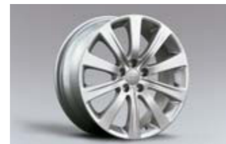
25 17" disky z ľahkých zliatin 28111FG020 W 17x7JJ offset 55