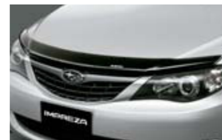
38 Ochrana kapoty motora

Chránia vaše vozidlo pred blatom a snehom. *Dodáva sa nenalakované.