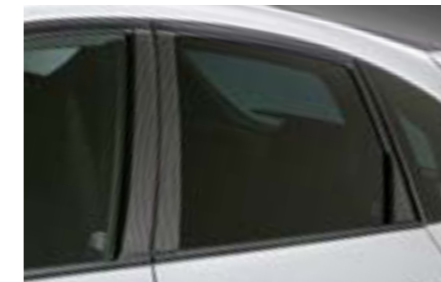
14 Kryt stĺpikov vo vzhľade karbónu E755EFG300 E Pre športový vzhľad B-stĺpika.