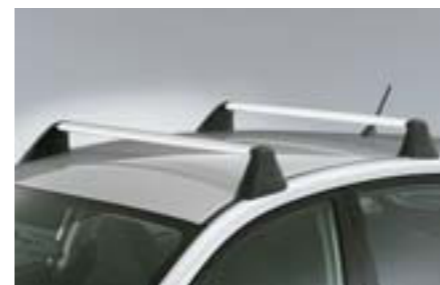
45 Hliníkový základný nosič E3610FG501 W Dokonalý dizajn a funkcia, na montáž špeciálnych nosičov.