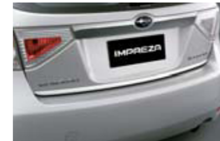
15 Chrómová ozdobná lišta zadných dvier (5-dv.) E755EFG000 W Chrómová lišta pre elegantný vzhľad.