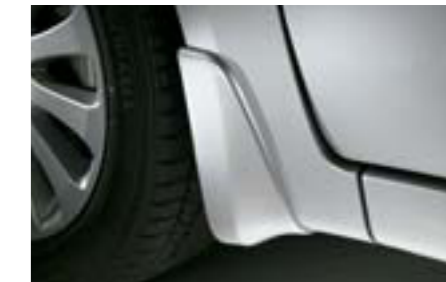
36 Predné zásterky