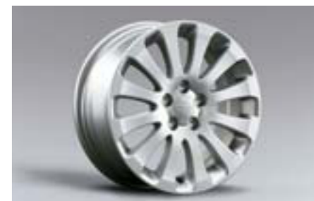
27 16" disky z ľahkých zliatin 28111FG010 W 16x6.5JJ offset 55