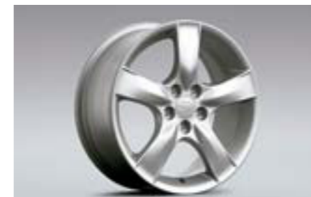
29 5-lúčové 16" disky z ľahkých zliatin 28111FE311 W 16x6.5JJ offset 55