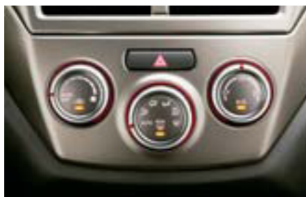
85 Manuálna klimatizácia G3010FG110 W Pre dodatočnú montáž klimatizácie. *Neplatí pre Slovensko.