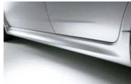
2 Bočné prahy E2610FG000NN W Dávajú vozidlu dravý vzhľad. *Dodáva sa nenalakované.