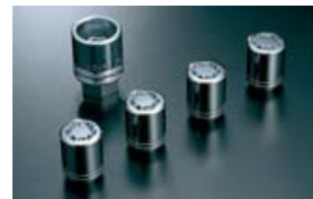
34 Bezpečnostné matice kolies B327EYA000 W Zabraňujú krádeži diskov a plášťov.