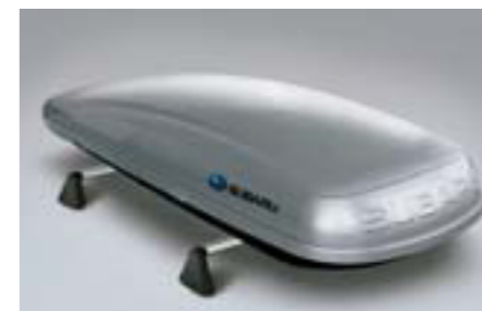
47 Strešný box veľký E361EYA900 W Rozmery: 2267 x 805 x 355 mm. Objem: 430 litrov *Vyžaduje sa základný nosič.