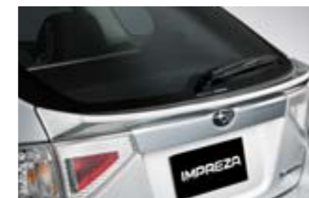
19 Zadný spojler E725EFG000 W Pre športový vzhľad. *Vyžaduje lakovanie a zosilnené vzpery zadných vyklápacích dvier.