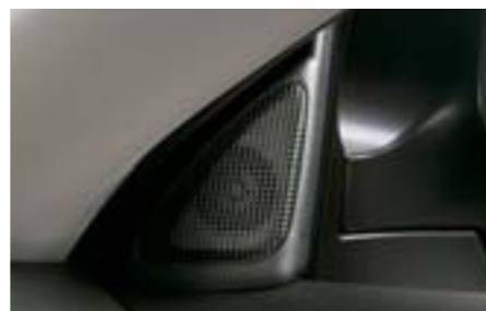
98 Výškové reproduktory H6310FG000 W Špeciálne reproduktory na zlepšenie zvuku vysokých tónov. *Len pre vozidlá s originálnym audiosystémom.