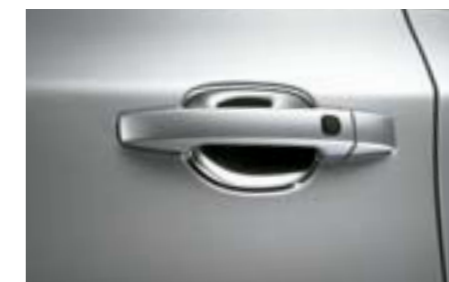
39 Ochrana kľučky dvier

Odolná plastová ochrana prednej časti kapoty motora. Účinne chráni pred odletujúcimi kamienkami.