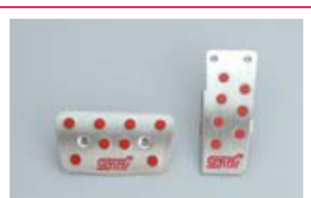
95 Športové pedále STI (AT) C8110AG010 W Športový hliníkový vzhľad. *Nie pre vozidlá so sériovými hliníkovými pedálmi.