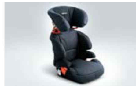
109 Detská sedačka SUBARU KID plus F410EYA212 W So zvýšenou ochranou pre prípad bočného nárazu.