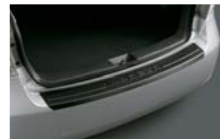
42 Ochrana nakladacej hrany (plast)

Chrání zadný nárazník pred ľahkými škrabancami.