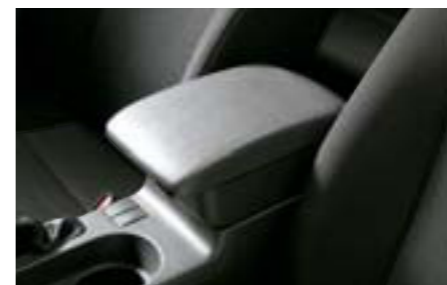
89 Zvýšenie laktovej opierky J2010FG000JC W Extra úložný priestor v laktovej opierke.