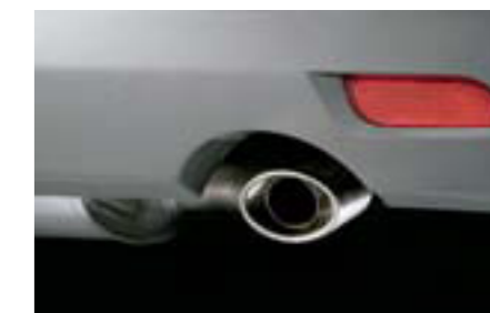
20 Koncovka výfuku 1.5R (5-dv.) D0510FG000 W Pre športový vzhľad.