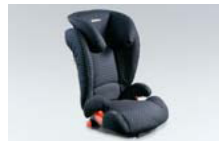
108 Detská sedačka SUBARU KIDFIX F410EYA213 W Bezpečná inštalácia vďaka ISOFIX. So zvýšenou ochranou pre prípad bočného nárazu.