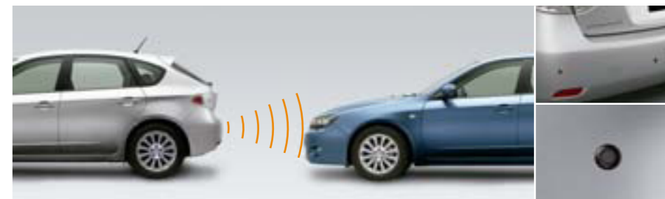
104 Parkovacie senzory (vpredu, vzadu) SEWAFG2101, SEWAYA2002 E Vpredu: Bezpečné a jednoduché parkovanie vďaka 2 senzorom. S akustickou výstrahou. Vzadu: Bezpečné a jednoduché parkovanie vďaka 4 senzorom. Akustická a vizuálna výstraha.