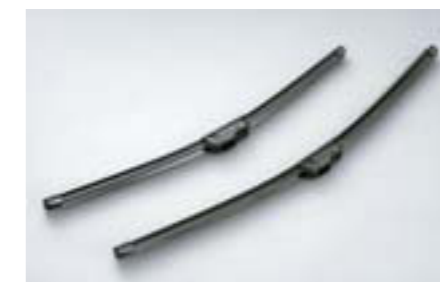
23 Lišty stieračov „Aero“ SEBOFG8000 E Aerodynamický dizajn pre vyššiu účinnosť stierania pri vysokých rýchlostiach.