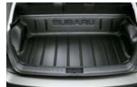
69 Vysoká vanička do batožinového priestoru J515EFG200 W Obzvlášť vhodná pre poľovníkov a rybárov.