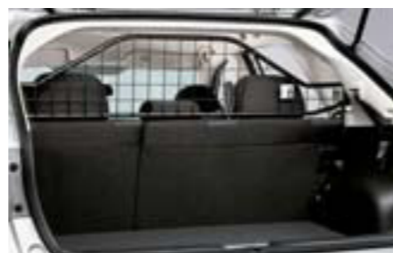
64 Deliaca mreža pre psov F555EFG000 W Oddeľuje batožinový priestor od priestoru pre pasažierov.