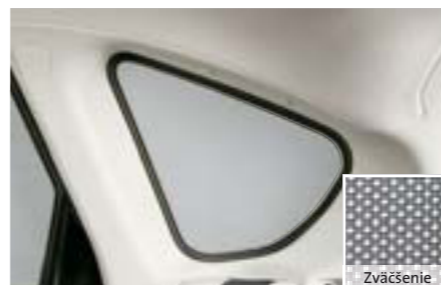
60 Zadné bočné slnečné clony (5-dv.) F505EFG100 W Na ochranu batožinového priestoru pred silnými slnečnými lúčmi. Priesvitná štruktúra mriežky.