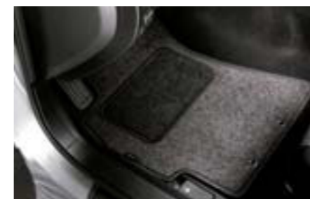
78 Koberčky čierne, Standard J505EFG101 W Presný tvar. *Súprava vpredu a vzadu.