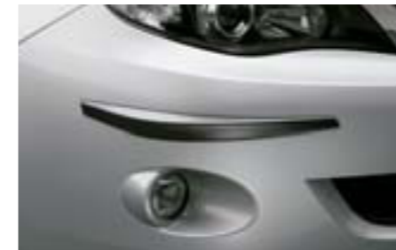
35 Ochrana rohov nárazníkov (5-dv., 4-dv.)