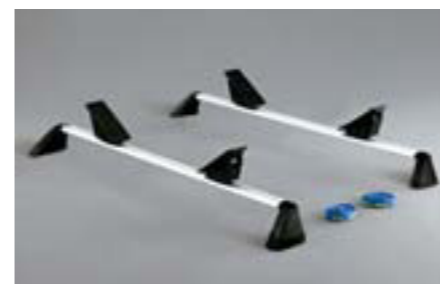
49 Nosič na kajak E361EAG600 W Pre 1 čln. *Vyžaduje sa základný nosič.