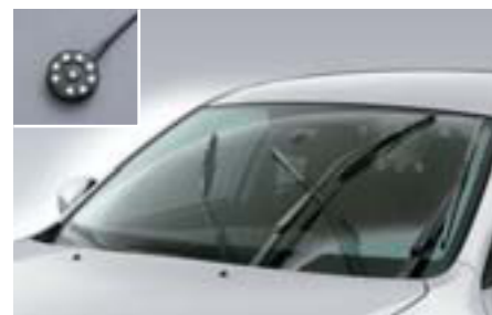
57 Dažďový senzor SEWAYA8000 E Automaticky aktivuje stierače čelného skla.