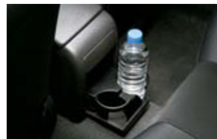
90 Držiak na nápoje vzadu J2010FG010JC W Držiak na nápoje pre zadný rad sedadiel. Praktická montáž na zadnej strane laktovej opierky.