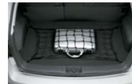
72 Sieťka do batožinového priestoru - podlaha J5510FG000 W Pre prehľadný a usporiadaný batožinový priestor.