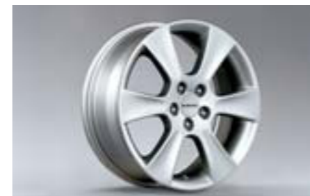
30 6-lúčové 16" disky z ľahkých zliatin SECWFE4001 E 16x6.5JJ offset 55