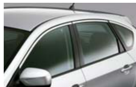
10 Chrómová okenná lišta (5-dv.) E755EFG100 W Elegantný chrómový prvok exteriéru.