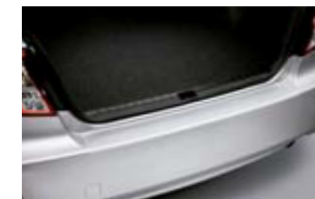
44 Ochrana nakladacej hrany priesvitná (4-dv.)

Chrání nakladaciu hranu pri nakladaní a vykladaní.