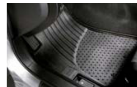
79 Gumené rohože J505EFG000 W Presný tvar. Na ochranu pred znečistením. *Súprava vpredu a vzadu.