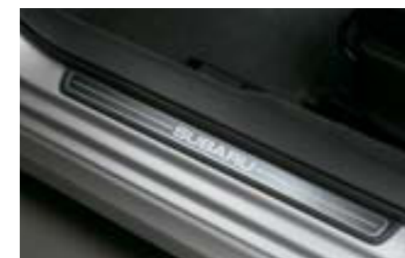
75 Prahové lišty E1010FG000 W Nahrádzajú sériové prahové lišty, dynamický vzhľad. *Súprava vpredu a vzadu.