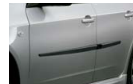
40 Bočné lišty

Pochromovaný plast. Chráni pred škrabancami.