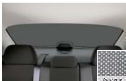
63 Slnečná clona na zadnom okne (4-dv.) F505EFG010 W Na ochranu batožinového priestoru pred silnými slnečnými lúčmi. Priesvitná štruktúra mriežky.