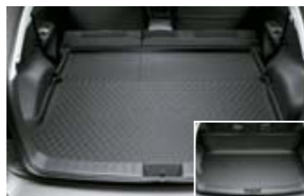
68 Rozkladacia vanička do batožinového priestoru J515EFG100 W Chrání batožinový priestor pred znečistením. Prídavná ochrana v prípade sklopenia operadiel zadných sedadiel.