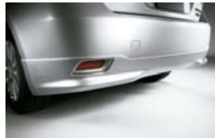
3 Zadný spodný spojler E5610FG000NN W Dáva vozidlu dravý vzhľad. *Dodáva sa nenalakované.