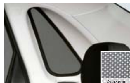
61 Zadné bočné slnečné clony (4-dv.) F505EFG110 W Na ochranu batožinového priestoru pred silnými slnečnými lúčmi. Priesvitná štruktúra mriežky.