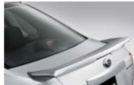
4 Zadný spojler E7210FG000NN W Dáva vozidlu dravý vzhľad. *Dodáva sa nenalakované.