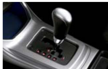
80 Kožená hlavica voliacej páky (AT) 35160FG010JC W Športová kožená hlavica voliacej páky pre automatickú prevodovku.