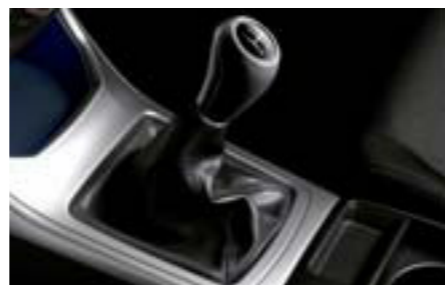
81 Kožená hlavica radiacej páky (MT) 35022AG000 W Športová kožená hlavica pre 5-st. manuálnu prevodovku.