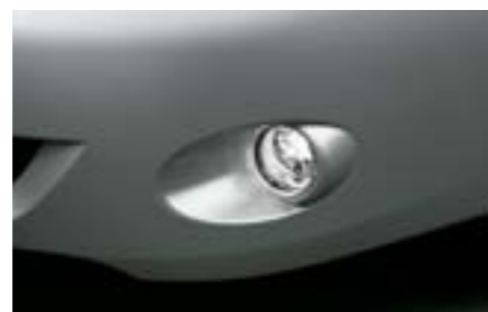
7 Svetlá do hmly H4510FG010 W Zlepšujú viditeľnosť v zlom počasi.