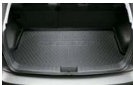
66 Vanička do batožinového priestoru (5-dv.) J515EFG000 W Chrání batožinový priestor pred znečistením. *Nie je možné použiť v prípade plnohodnotného náhradného kolesa.