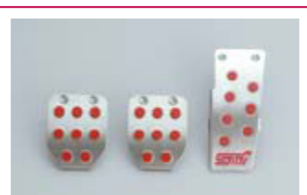
94 Športové pedále STI (MT) C8110AG000 W Športový hliníkový vzhľad. *Nie pre vozidlá so sériovými hliníkovými pedálmi.

FHI v spolupráci s STI v snahe zvýrazniť vzhľad vozidla vyvinuli koncept „Total Tuning“.