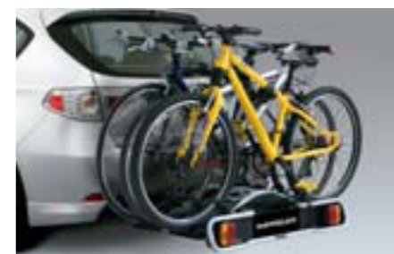
55 Nosič na 3 bicykle na ťažné zariadenie E365EFG800 / E365EFG900 W Na prepravu 3 bicyklov na ťažnom zariadení. *Vyžaduje sa ťažné zariadenie.