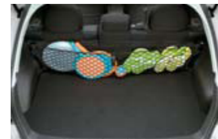
71 Sieťka do batožinového priestoru (zadný rad sedadiel) F551SFG200 W Pre prehľadný a usporiadaný batožinový priestor. Ideálny doplnok k bočným sieťkam.