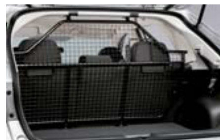
65 Deliaca mreža pre psov F555EFG100 W Oddeľuje batožinový priestor od priestoru pre pasažierov. *Nie je možné použiť v prípade plnohodnotného náhradného kolesa.