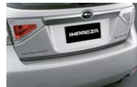
17 Karbónová ozdobná lišta zadných dvier (5-dv.) E755EFG010 E Karbónová lišta pre elegantný vzhľad.