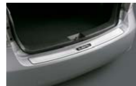
41 Ochrana nakladacej hrany odolná proti poškrabaniu