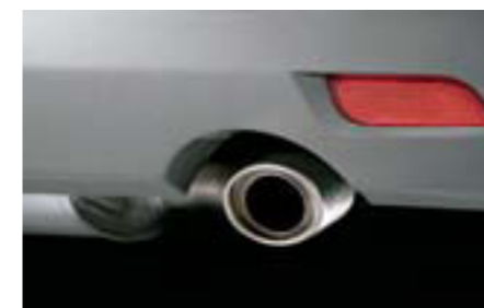
21 Koncovka výfuku 2.0R (5-dv.) / 1.5R, 2.0R (4-dv.) D0510FG020 W Pre športový vzhľad. *2.0R (4-dv.): vyžadujú sa 2 kusy.