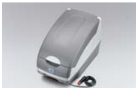
58 Chladiaci box Subaru SEWAYA1000 E Na udržiavanie potravín v chlade alebo teplu.