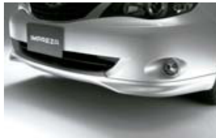
1 Predný spojler E2410FG000NN W Dáva vozidlu dravý vzhľad. *Dodáva sa nenalakované.