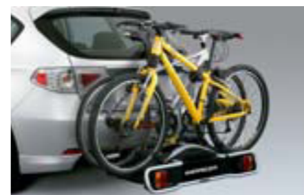
54 Nosič na 2 bicykle na ťažné zariadenie E365EFG600 / E365EFG700 W Na prepravu 2 bicyklov na ťažnom zariadení. *Vyžaduje sa ťažné zariadenie.