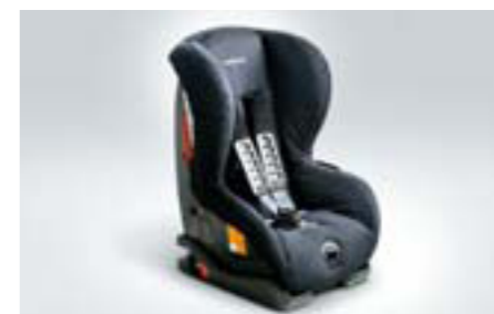
107 Detská sedačka SUBARU Duo Plus F410EYA002 W Bezpečná inštalácia vďaka ISOFIX.