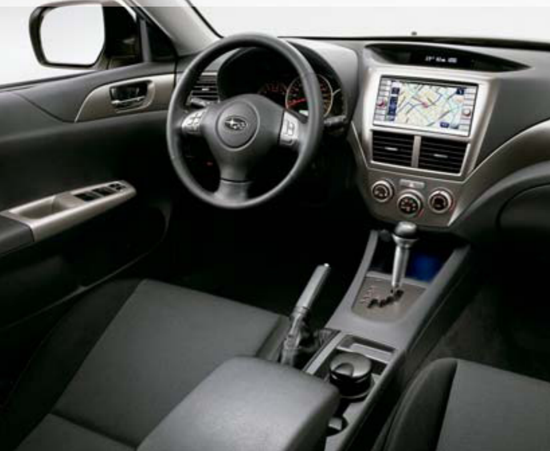
Vozidlo na obrázku je vybavené hliníkovou voliacou pákou, okrúhlym popolníkom, stredovou konzolou a navigačným systémom.