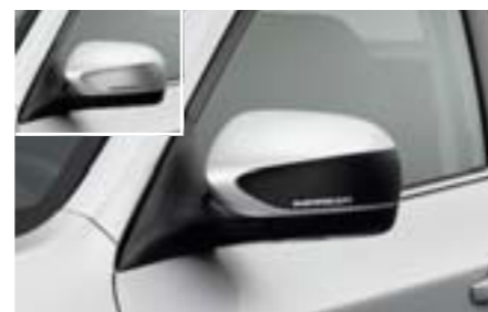
8 Fólia na spätné zrkadlá (čierna, strieborná) SEBDFG3000, SEBDFG3010 E Vysokokvalitná fólia zmení vzhľad vonkajších spätných zrkadiel.