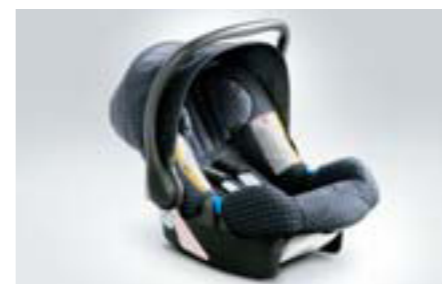
106 Detská sedačka SUBARU Baby Safe Plus F410EYA102 W Komplet so slnečnou clonou.