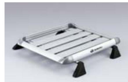
46 Nosič na batožinu E365ESC200 W Výraznou mierou rozširuje možnosti prepravy. *Vyžaduje sa základný nosič.