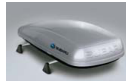
48 Strešný box malý E361EYA801 W Rozmery: 1792 x 797 x 355 mm. Objem: 380 litrov *Vyžaduje sa základný nosič.