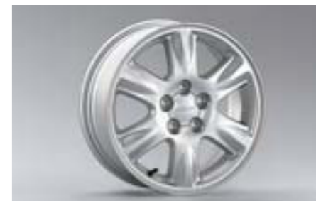
31 6-lúčové 15" disky z ľahkých zliatin 28111SA011 W 15x6JJ offset 48