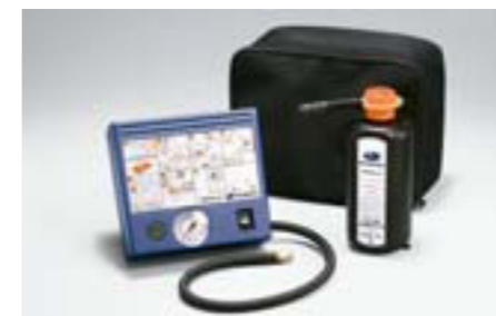
33 Súprava na opravu pneumatík SETSYA4000 E Kompaktná súprava s tesniacou hmotou a minikompressorom, jednoduchá obsluha.