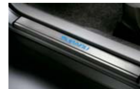
76 Prahové lišty s osvetlením SENOFG1000 E Nahrádzajú sériové prahové lišty, dynamický vzhľad. *Vyžaduje sa montážna súprava.