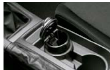
88 Okrúhly popolník F6010FG000 W Okrúhly popolník do držáka na nápoje.