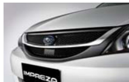
6 Predná mriežka s dizajnom krídla J1010FG040 W Predná mriežka chladiča s prídavnou chrómovou lištou, ktorá zásadne zmení vzhľad prednej časti.