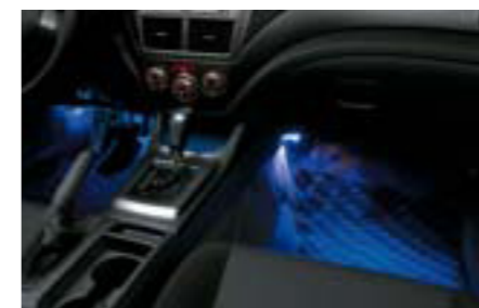
74 Osvetlenie priestoru pre nohy H7010SC000 W Po otvorení dvier automaticky osvetlí priestor pre nohy a uľahčuje nastupovanie a vystupovanie za tmy. *Vyžaduje sa montážna súprava.