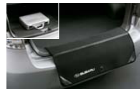
73 Ochranná rohož pre nakladaciu hranu SEBCAG2000 E Chrání nárazník pred poškodením pri nakladaní a vykladaní. Druhá strana slúži ako protisklzová rohož.