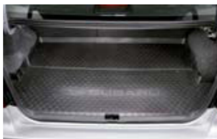
67 Vanička do batožinového priestoru (4-dv.) J515EFG010 W Chrání batožinový priestor pred znečistením. *Nie je možné použiť v prípade plnohodnotného náhradného kolesa.