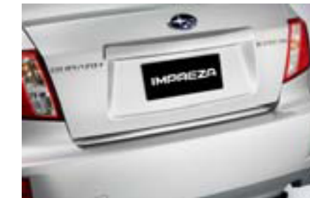
16 Chróm. ozdobná lišta veka bat. priestoru (4-dv.) E755EFG020 W Chrómová lišta pre elegantný vzhľad.