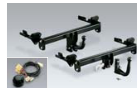
56 Ťažné zariadenie odnímateľné Pozrite si tabuľku s prehľadom W