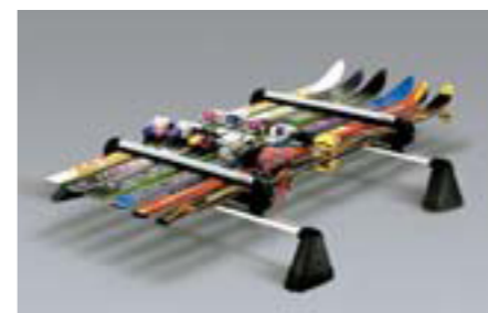
50 Nosič na lyže (6 párov) E361EAG550 W Až pre 6 párov lyží alebo 4 snowboardy. Využitelná šírka: 640 mm *Vyžaduje sa základný nosič.