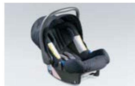
105 Detská sedačka SUBARU Baby Safe ISOFIX Plus F410EYA103 W Komplet so slnečnou clonou. Bezpečná inštalácia vďaka ISOFIX.