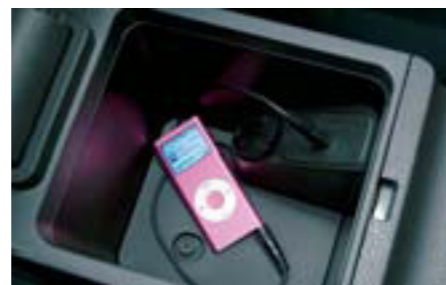
97 Audio vstup H6210FG000 W Pripojenie na 3,5 mm stereo jack. Umožňuje pripojenie prenosného prehrávača. *Len pre vozidlá s originálnym audiosystémom.