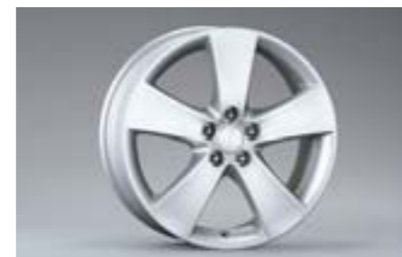
26 5-lúčové 17" disky z ľahkých zliatin SECWFE4101 E 17x7JJ offset 55