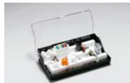
92 Súprava náhradných žiaroviek Pozrite si tabuľku s prehľadom. E Súprava náhradných žiaroviek pre jednotlivé vozidlá so všetkými žiarovkami a poistkami. *Xenónové výbojky a LED nie sú súčasťou súpravy. Obsah sa môže od obrázku líšiť.