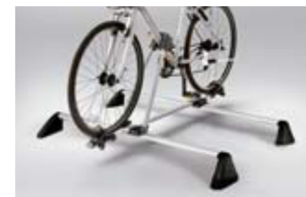
52 Nosič bicykla E365ESC100 W Dokonalý doplnok pre základný nosič. *Vyžaduje sa základný nosič.