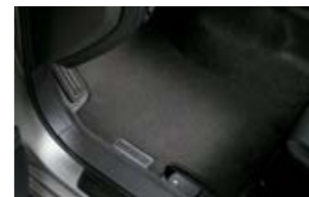
77 Koberčky čierne, premium J505EFG201 W Presný tvar, s logom. *Súprava vpredu a vzadu.