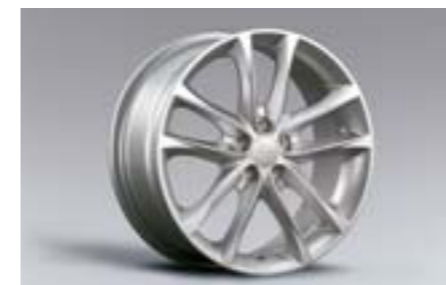
24 17" disky z ľahkých zliatin B3110FG100 W 17x7JJ offset 55