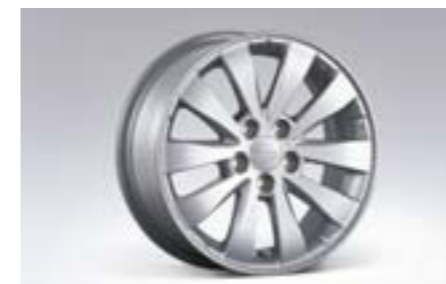
32 10-lúčové 15" disky z ľahkých zliatin 28111FG100 E 15x6JJ offset 48