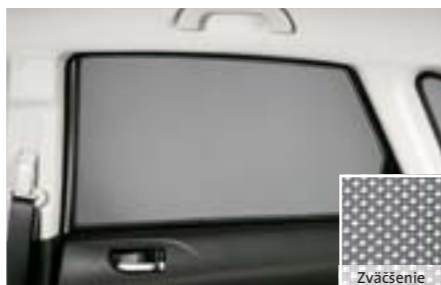
59 Zadné bočné slnečné clony F505EFG200 W Na ochranu batožinového priestoru pred silnými slnečnými lúčmi. Priesvitná štruktúra mriežky.