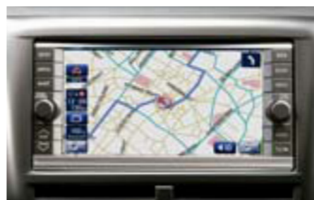
100 Navigačný systém H001EFG001 W Exkluzívny dizajn, ľahké ovládanie prostredníctvom dotykového displeja. Zahŕňa rádio, CD a DVD prehrávač. Príprava na Bluetooth hands-free súpravu. *Nezahŕňa navigačné DVD