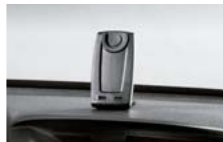
91 Držiak na mobilný telefón SERHYA6000 E Elegantný univerzálny držiak. Ideálny v spojení s Bluetooth hands-free súpravou.