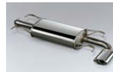
22 Športový výfuk 1.5R, 2.0R SEREFG5200, SEREFG5000 E Pre športový zvuk motora boxer.