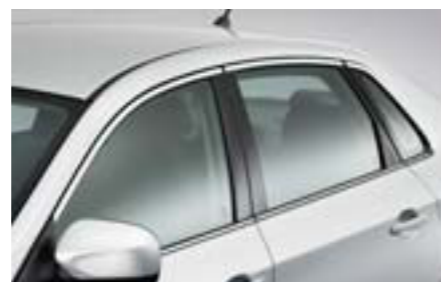
11 Chrómová okenná lišta (4-dv.) E755EFG110 W Elegantný chrómový prvok exteriéru.