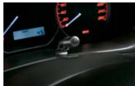
102 Mikrofón pre hlasové ovládanie H0018FG300 W Umožňuje voľné telefonovanie s mobilným telefónom. *Len v spojení s originálnym navigačným systémom.