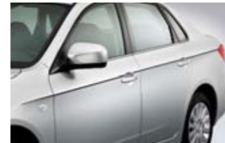
13 Chrómová bočná lišta (4-dv.) E755EFG210 W Elegantný chrómový prvok exteriéru.