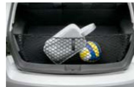
70 Sieťka do batožinového priestoru (zadné vyklápacie dvere) F551SFG100 W Pre prehľadný a usporiadaný batožinový priestor.