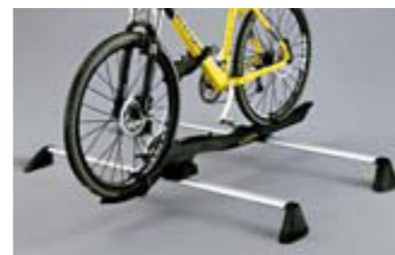
53 Nosič bicykla (Barracuda) E361ESA501 W Nosič bicykla s aerodynamickým dizajnom, jednoduchá montáž. *Vyžaduje sa základný nosič.