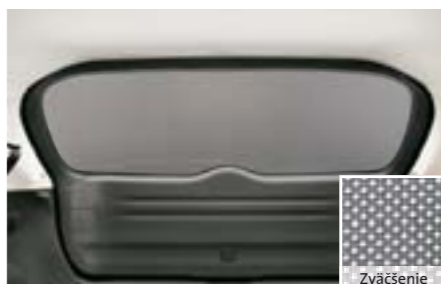
62 Slnečná clona na okne zadných vyklápacích dvier (5-dv.) F505EFG000 W Na ochranu batožinového priestoru pred silnými slnečnými lúčmi. Priesvitná štruktúra mriežky.