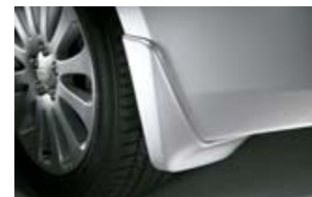
37 Zadné zásterky (5-dv., 4-dv.)

Chránia vaše vozidlo pred blatom a snehom. *Dodáva sa nenalakované.