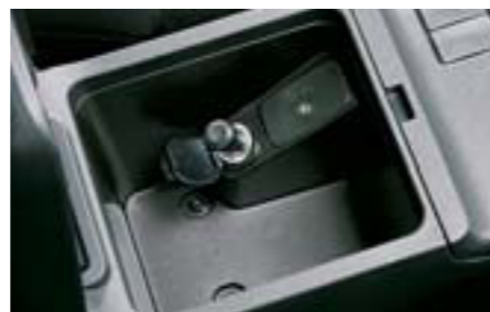
87 Zapaľovač cigariet H6710FG000 W Zapaľovač cigariet do odkladacej priehradky.