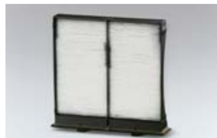
86 Peľový filter 72880FG000 W Chrání interiér vozidla pred prachom a pelom. Odporúča sa meniť filter každoročne, resp. každých 12 000 km. *Nahrádza štandardný filter.