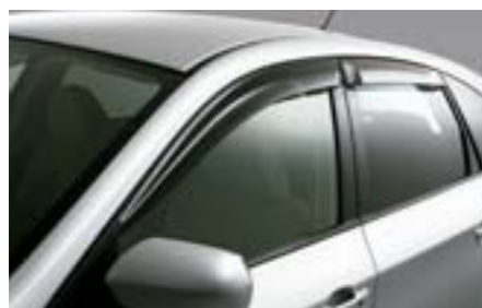
9 Okenné deflektory E3610FG000 W Aj za dažďa umožňujú jazdu s mierne pootvoreným oknom.