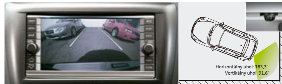
103 Spätná kamera (pomôcka pri parkovaní) H0010FG000 W Spätná kamera s vysokým rozlíšením 250 000 pixlov. Po zaradení spiatky ponúka neobmedzený pohľad dozadu a optimálny prehľad pri parkovaní. Horizontálny uhol: 183,3°. Vertikálny uhol: 91,6° *Iba v spojení s DVD navigáciou