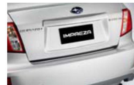
18 Karbón. ozdobná lišta veka bat. priestoru (4-dv.) E755EFG030 E Karbónová lišta pre elegantný vzhľad.