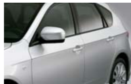
12 Chrómová bočná lišta (5-dv.) E755EFG200 W Elegantný chrómový prvok exteriéru.